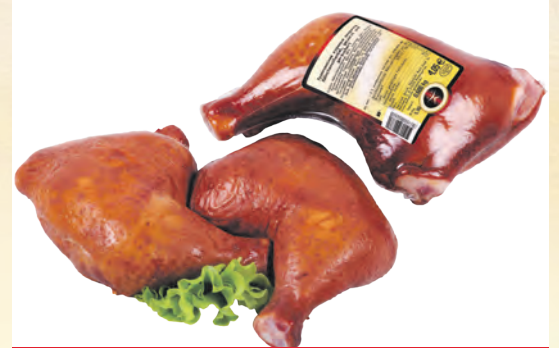
Hähnchenschenkel, gewürzt und geräuchert