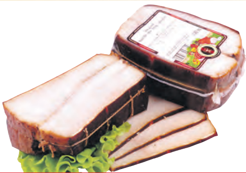
Gewürzter Speck "Dimnoe" geräuchert