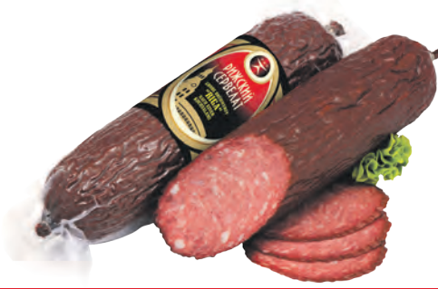
Cervelatwurst "Riga" nach einem lettischen Rezept