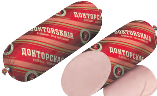
Brühwurst, fein zerkleinert "Doktorskaja"