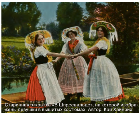
Старинная открытка «В Шпреевальде», на которой изображены девушки в вышитых костюмах. Автор: Кай Хайнрих.

В Нижней Саксонии находится крупный музей, где