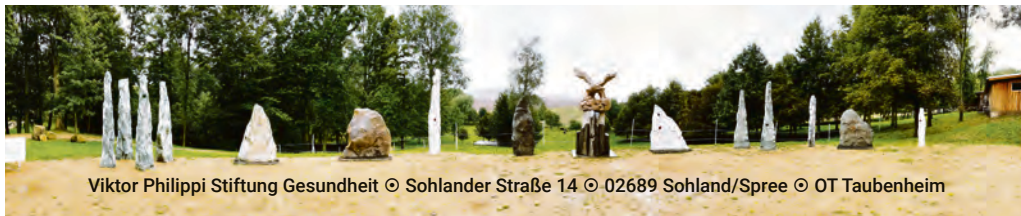
Viktor Philippi Stiftung Gesundheit © Sohlander Straße 14 © 02689 Sohland/Spree © OT Taubenheim