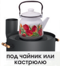
ПОД чайник или кастрюлю