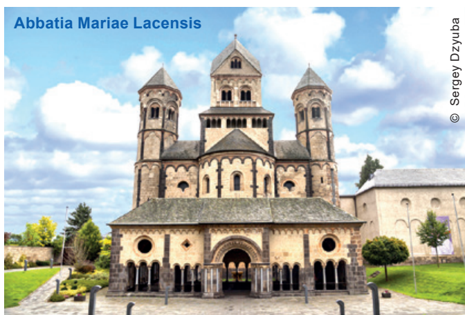
Abbatia Mariae Lacensis

Kloster Wiblingen – расположен в г. Ульм. На его территории находятся несколько корпусов медуниверситета, музей-библиотека, муниципальные здания и католическая церковь. В 1099 году состоялся Первый крестовый поход, когда сюда доставили частичку Креста распятия Иисуса. Много веков монастырь был подвержен грабежам, пожарам, крушениям. Это стало причиной того, что в первоначальном виде сохранить его не удалось. Работы по реконструкции начались только в 1714 году. Однако в 1806 году монастырь рас-